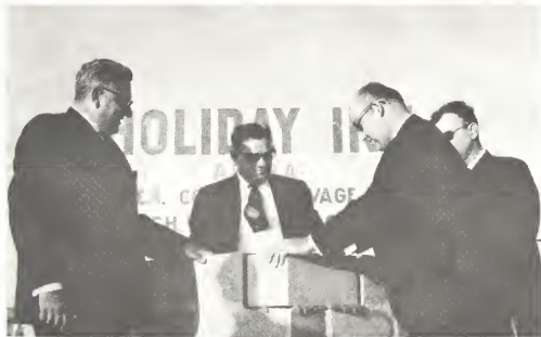
E promer acto simbolico den principiamiento di construcion di e Hotel a tuma lugar dia 28 di september 1968. Riba e foto Gezaghebber O .S. Henriquez ta efectuando e acto aki, pa inicia oficialmente construcion di Aruba Holiday Inn.